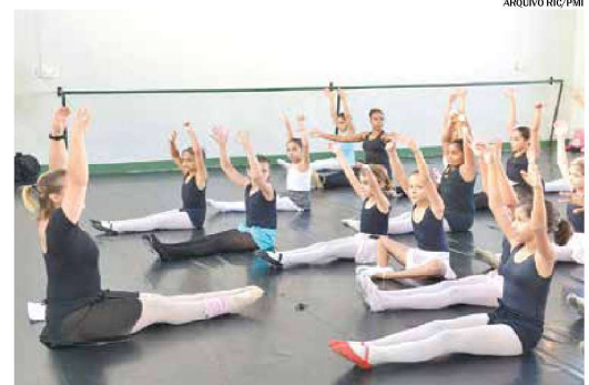
Ao todo, serão ofertadas 974 vagas que serão divididas entre os cinco locais